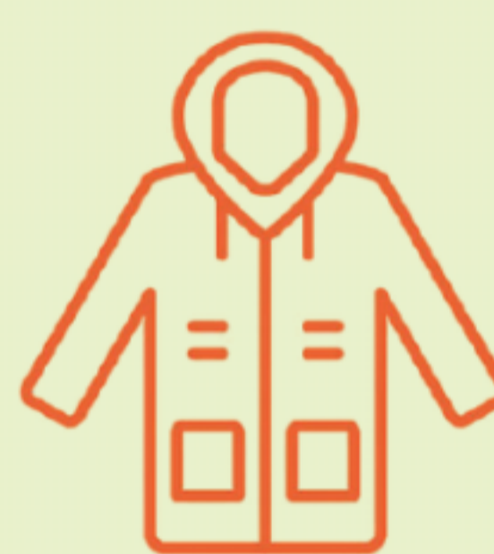
Abbigliamento da esterno