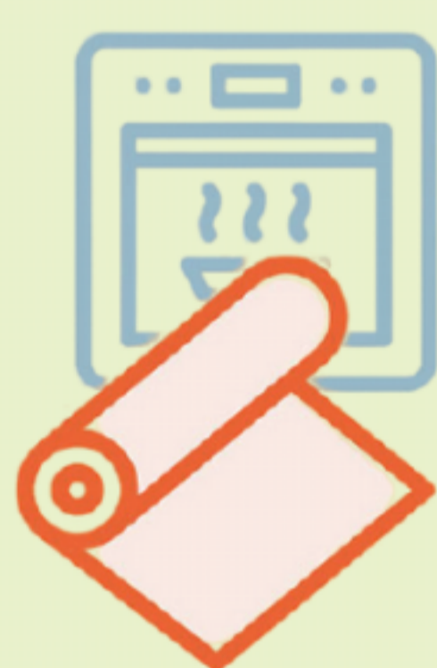
Carta da forno